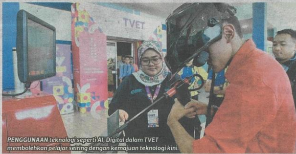
PENGGUNAAN teknologi seperti AI, Digital dalam TVET membolehkan pelajar seiring dengan kemajuan teknologi kini.