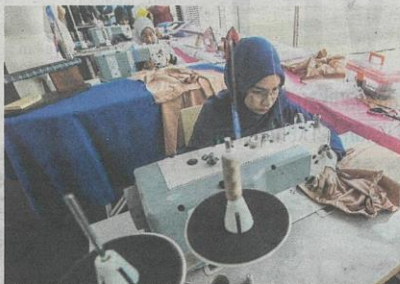
TUMPUAN kepada latihan TVET dapat memperkasakan individu yang mempunyai kemahiran dan mengukuhkan kapasiti tenaga kerja.

Kenaikan sebanyak 15 peratus PCG nyata merangsang perkembangan pendidikan TVET ke arah arus perdana