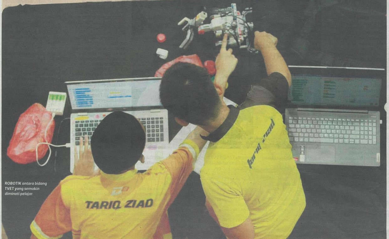
ROBOTIK antara bidang TVET yang semakin diminati pelajar.